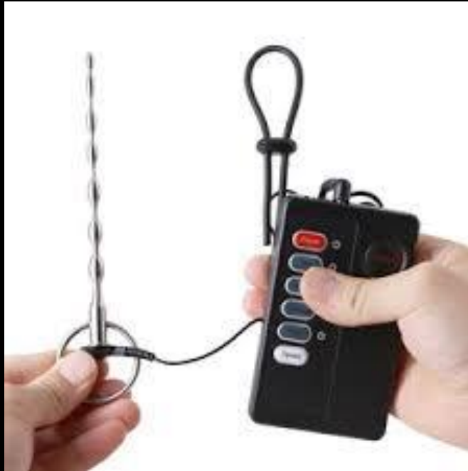
Enchufe eléctrico para pene