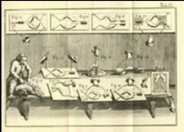
Pruebas de Galvani en ancas de rana A mediados del siglo XIX...

Sin embargo, fue Luigi Galvani en 1791 (médico y físico italiano) quien proporcionó la primera prueba científica de que la corriente puede activar los músculos. Fue a finales de la década de 1770 cuando se interesó por primera vez en la influencia de la electricidad. Luego, multiplicará los experimentos con ranas aplicando electricidad directamente a los nervios.